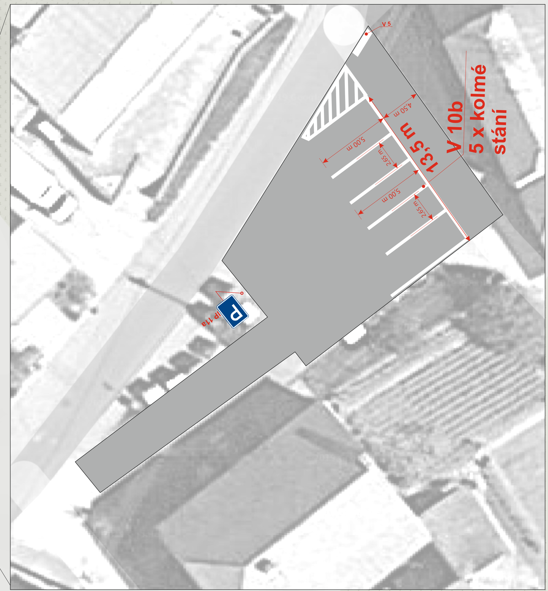
Schéma parkování na veřejném parkovišti naproti COOP Jednota Vrbsice 344