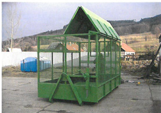
ilustrační foto drátěného kontejneru

Tento kontejner je určen pro sběr a shromažďování papíru. Kontejner bude „drátěného typu“ se střechou pro ochranu papírových odpadů před povětrnostními podmínkami a úletem.