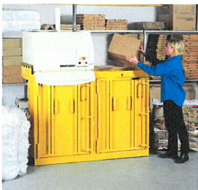
Ilustrační foto paketovacího dvoukomorového lisu

Paketovací dvoukomorový lis bude určen pro optimalizaci objemu ručně vytříděných využitelných složek KO (papíru, plastů) pro optimalizaci jednotlivých svozů k materiálovému využití.