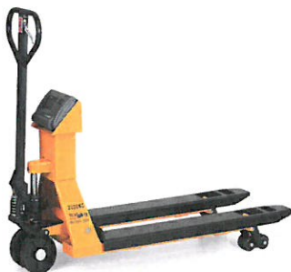
Ilustrační foto manipulačního paletovacího vozíku

Manipulační technika sběrného dvora – paletový vozík s váhou pro manipulaci s balíky, velkoobjemovým odpadem, pneumatikami apod., který zároveň umožní zvážení odpadu pro usnadnění evidence.