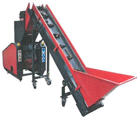
Ilustrační foto drtiče plastů