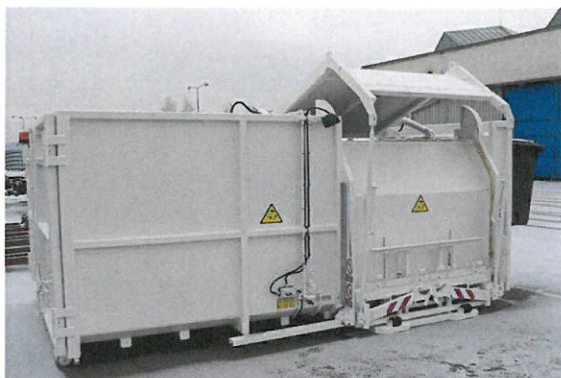
Ilustrační foto kontejnerového nosiče

Základem je, aby byl kontejnerový nosič kompatibilní se současným svozovým vozidlem, které obec Vrbice používá, tzn., že maximální rozměry základny budou 2,4 x 4,5 m. Typ připojení, resp. výška háku 1.000,00 mm.